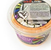
MEDLINE CHEESE CREAM SWEET PEPPER ART. NR. 29700 6 X 450 G