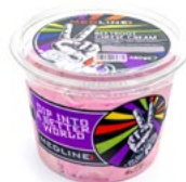
MEDLINE CHEESE CREAM BEETROOT ART. NR. 65268 6 X 450 G