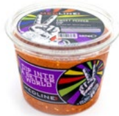
MEDLINE SWEET PEPPER DIP ART. NR. 29490 6 X 450 G