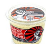
MEDLINE HUMMUS GINGER ART. NR. 28410 6 X 450 G