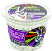
MEDLINE TZATZIKI ART. NR. 29940 6 X 450 G