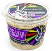
MEDLINE BABAGANOUSH ART. NR. 65447 6 X 450 G