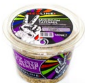
MEDLINE MUSHROOM TAPENADE ART. NR. 29870 6 X 450 G