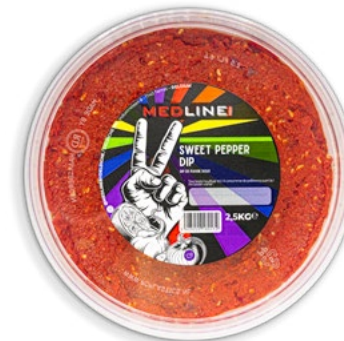
MEDLINE SWEET PEPPER DIP ART. NR. 66029 1 X 2,5 KG