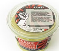
MEDLINE HUMMUS AVODADO ART. NR. 66000 6 X 450 G