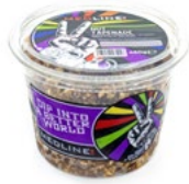
MEDLINE NUT TAPENADE ART. NR. 09320 1 X 450 G