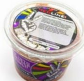
MEDLINE TOMATO SALSA ART. NR. 29951 6 X 450 G