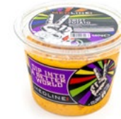
MEDLINE SWEET POTATO CREAM ART. NR. 29910 6 X 450 G