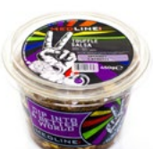
MEDLINE TRUFFLE/KALAMATA ART. NR. 29680 6 X 450 G