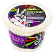
MEDLINE CHEESE CREAM TRUFFLE ART. NR. 65269 6 X 450 G