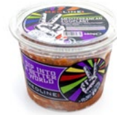
MEDLINE MEDITERRANEAN EGGPLANT ART. NR. 29970 6 X 450 G