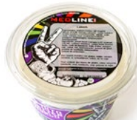
MEDLINE LABNEH ART. NR. 66324 6 X 450 G

Alle producten zijn verkrijgbaar in grote verpakkingen voor industriële en cateringtoepassingen.