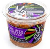
MEDLINE TOMATO TARTARE ART. NR. 65138 6 X 450 G