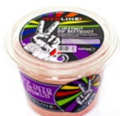
MEDLINE CHESTNUT DIP BEETROOT ART. NR. 29710 1 X 450 G