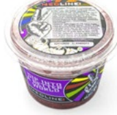
MEDLINE APPEL - VEENBESSEN CHUTNEY CHUTNEY DE POMMES ET DE CANNEBERGES ART. NR. 66121 6 X 450 G