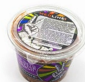
MEDLINE MEXICAN SALSA ART. NR. 65187 6 X 450 G