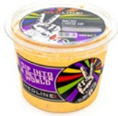
MEDLINE NACHO CHEESE DIP ART. NR. 29990 6 X 450 G