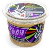
MEDLINE EGGPLANT CAVIAR ART. NR. 65270 6 X 450 G