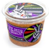
MEDLINE MUHAMMARA ART. NR. 65344 6 X 450 G