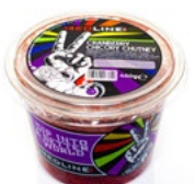
MEDLINE CRANBERRY-CHICORY CHUTNEY ART. NR. 65277 6 X 450 G