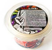
MEDLINE HUMMUS LEMON ART. NR. 66325 6 X 450 G