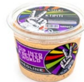
MEDLINE KTIPIITI ART. NR. 29900 6 X 450 G