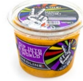
MEDLINE MANGO CHUTNEY ART. NR. 29850 6 X 450 G