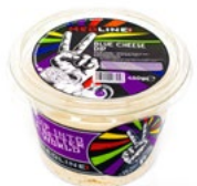
MEDLINE BLUE CHEESE DIP ART. NR. 29880 6 X 450 G