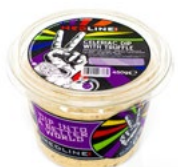
MEDLINE CELERIAC DIP WITH TRUFFLE ART. NR. 29720 6 X 450 G